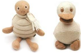
ぬいぐるみイメージは、このようなタッチで、「オーガニック」を想起させるものに。